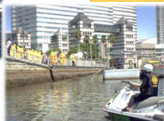
写真: ピカチュウだけじゃないピカチュウ大量発生チュウ!