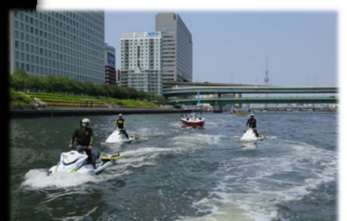
写真: 水上パトロールの様子